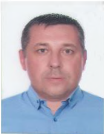
ФОТО ДЕЛЕГОВАНОГО ПРЕДСТАВНИКА ГРОМАДСЬКОЇ СПІЛКИ «АСОЦІАЦІЯ З ЗАХИСТУ ПРАВ ІНВЕТОРІВ ЖИТЛОВОГО БУДІВНИЦТВА В М.КИЄВІ»